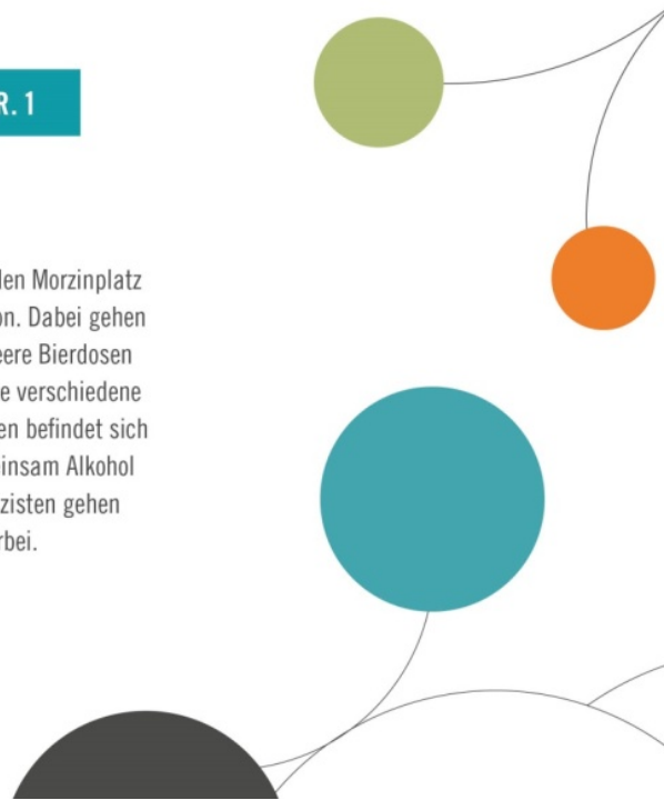
Abb. 2: Vignettenbeispiel „Schwedenplatz“ 4

Es ist Freitag Abend und Sie gehen über den Morzinplatz Richtung Schwedenplatz zur U-Bahnstation. Dabei gehen Sie an einer großen Grünfläche vorbei. Leere Bierdosen liegen auf dem Weg. Auf Bänken sehen Sie verschiedene Menschen, die sich unterhalten. Unter ihnen befindet sich auch eine Gruppe Jugendlicher, die gemeinsam Alkohol trinkt und sich laut unterhält. Zwei Polizisten gehen an der Gruppe Jugendlicher vorbei.